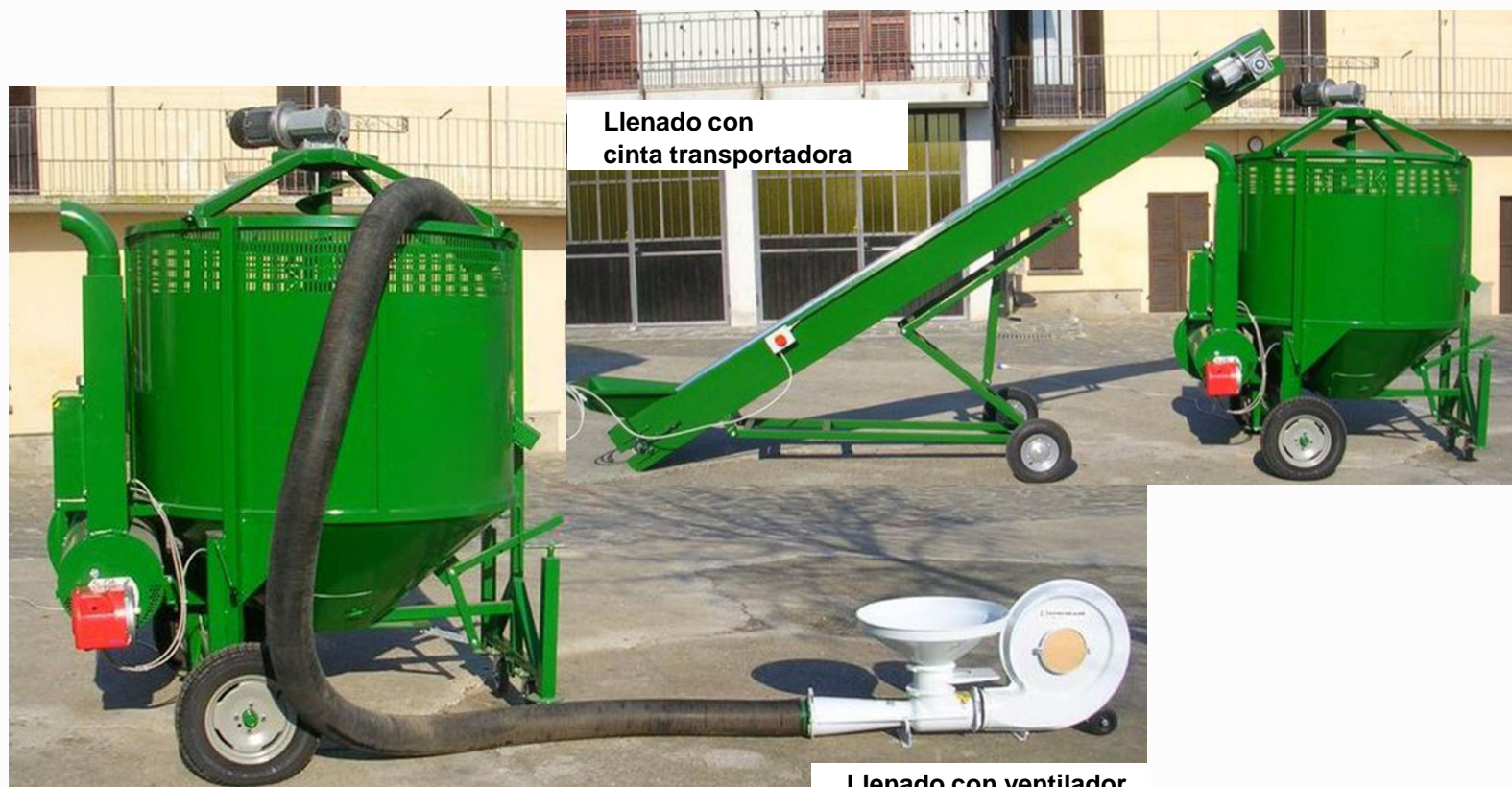
Llenado con cinta transportadora